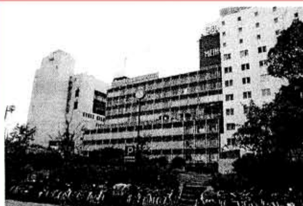
勉強会の対象となる現地。名豊ビル(右)と再開発ビル(手前)が狭間児童広場(左)と豊橋駅前大通南地区2丁目